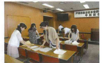
メンバー同心をこめて準備しました