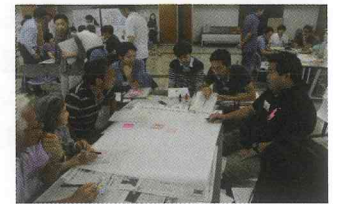
これまでたくさんの会議で一生懸命検討しました