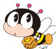
生涯学習マスコット 「マナビィ」