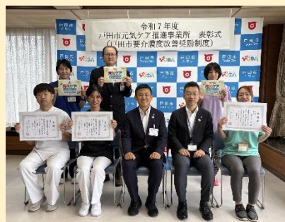
▲令和7年度の表彰式の様子