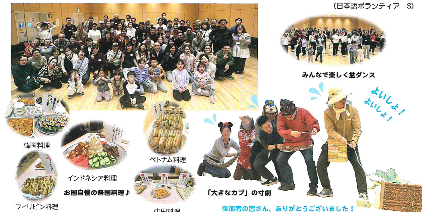
みんなで楽しく盆ダンス 韓国料理 ベトナム料理 インドネシア料理 お国自慢の各国料理♪ フィリピン料理 中国料理 「大きなカブ」の寸劇 参加者の皆さん、ありがとうございました!