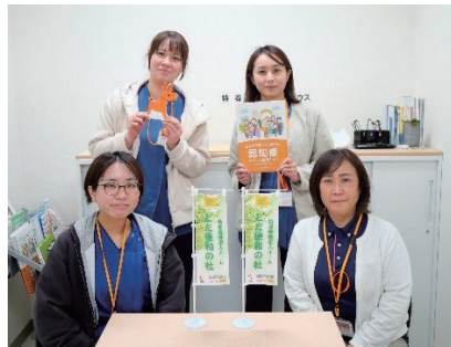
とだ優和の杜 新曽南4-2-35 ☎048-499-3010 (随時相談可)