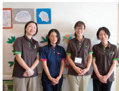
ふれあい 多居夢戸田 上戸田1-2-11 ☎048-447-7000 (随時相談可)