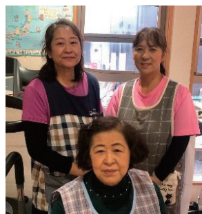
グループホーム氷川 氷川町1-4-2 ☎070-1295-6548 (随時相談可)