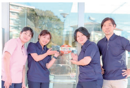
戸田中央リハビリテーション病院 新曽南4-1-29 ☎080-7322-8681 (随時相談可)