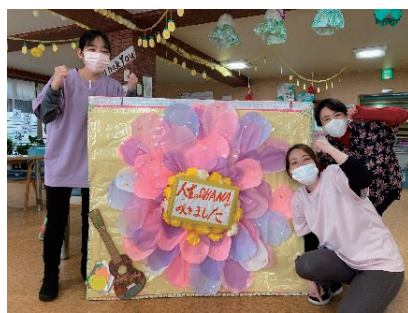
ソレアド戸田 美女木8-21-17 ☎048-449-4807 (月～金曜日10:00～15:00)