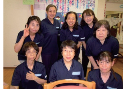
ニチケアセンター戸田中町 中町2-6-17 ☎048-420-3505 (毎週火曜日14:00～16:00)