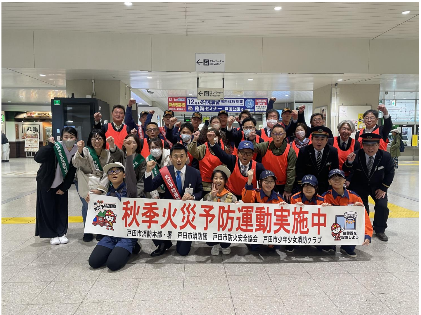
全国秋季火災予防運動