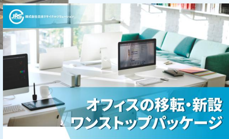
オフィスの移転・新設 ワンストップパッケージ