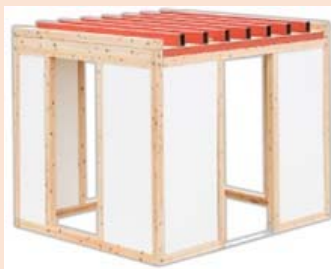
耐震シェルター事例

建物が倒壊しても安全な生存空間が確保できる耐震シェルター、防災ベッドを利用した改修方法です。既存住宅に設置するもので、住みながらの設置が可能で、一般改修に比べ安価に設置できます。