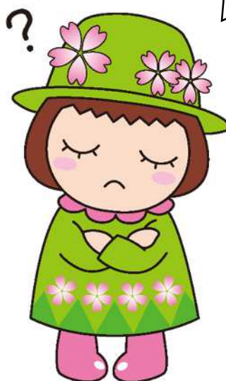
戸田ヶ原自然再生キャラクター とだみちゃん