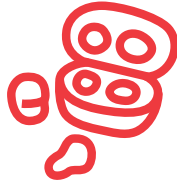
ワイヤレスイヤホン