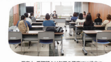
保育士・看護師より毎日の子育てに役立つヒントをお話しいただきました

育児にまつわる様々な分野の専門の先生を講師として招いて講演会を開催しています。育児に奮闘する皆さんのちょっとした気づきになるようなお話をさせていただきます。