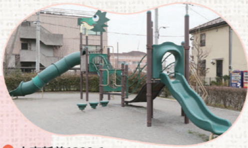
あしはら こうえん 芦原たんぼ公園

📍 大字新曽1299-1 緑のドラゴンの滑り台は迫力満点! 見ているだけでも楽しいです。