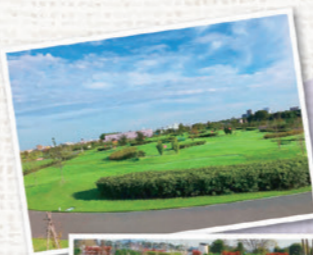
あらかわみずじゅんかん じょうぶ こうえん 荒川水循環センター上部公園