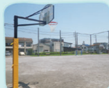
②中町青少年の広場 場 中町2-8