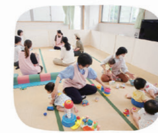
東小広場デビューサロン