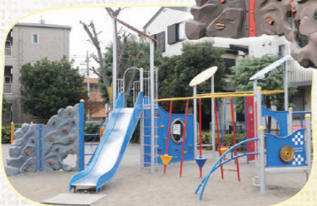
しもまえ こうえん 下前公園