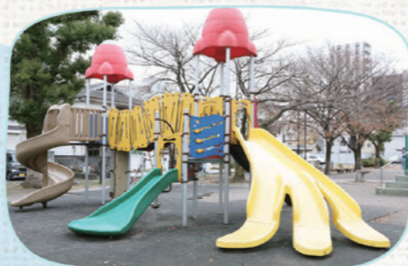
あずまちょうこうえん 東町公園

📍 上戸田2-41 バナナの滑り台の複合遊具や小さい子向けの複合遊具もあり、水と緑が豊かな公園です。