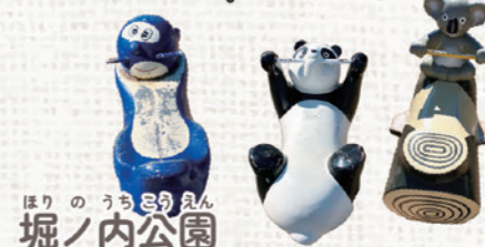
ほりのうちこうえん 堀ノ内公園