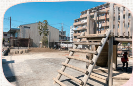
しんでん ふんすいこうえん 新田ふれあい噴水公園