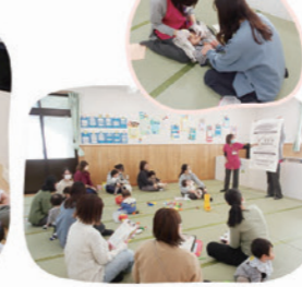
歯磨きどうしてる?サロン