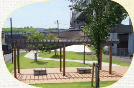
とだりよくち 戸田1緑地