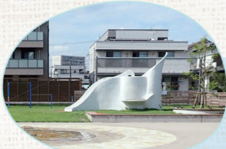
おおまえ こうえん 大前公園