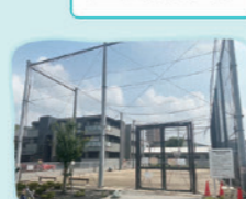
③新曽青少年の広場 場 大字新曽766