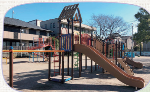
ねぎはしこうえん 根木橋公園

📍 笹目2-22 ローラー滑り台や複合遊具があります。プリムローズに近接しており、児童の集う場所です。