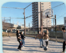
①本町青少年の広場 場 本町5-1