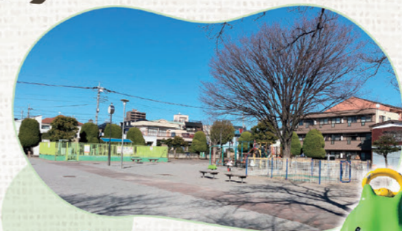
やぐちこうえん 谷口公園

📍 笹目2-22 ローラー滑り台や複合遊具があります。プリムローズに近接しており、児童の集う場所です。