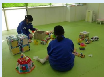
親子ふれあい広場(玩具の清掃)

12月9日(火)～11日(木)の3日間、美笹中学校2年生2名が窓口業務のほか、親子ふれあい広場やサークル(お達者クラブ)活動、講座チラシや図書館の本の紹介(ポップづくり)、浴室準備など多くの体験を行いました。生徒からは、「初めてやることばかりで緊張したが、仕事への理解を深めることができ、この3日間で貴重な経験ができました」等の感想をいただきました。