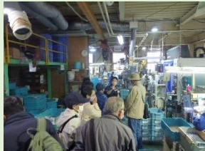
三協ダイカスト(株)