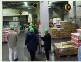
JA全農青果センター(株)