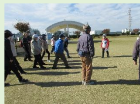
上部公園(正しい歩き方)

第1回は保健師による講義で、健康と運動の関わりについて学び、日本ウォーキング協会指導員による正しい歩き方を実習し、第2～4回は、館外で上部公園ウォーキング実践や、三協ダイカスト、JA全農青果センターを見学しました。参加者からは、「ウォーキングの正しい姿勢、歩き方をしっかり学んでからのスタートで、日常生活に役立つ良い講座でした」「普段見ることが出来ない会社や工場を知ることができて良かった」等とても好評でした。