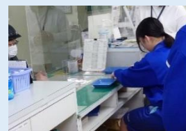
福祉センター窓口 (ゴミ収集券の販売)