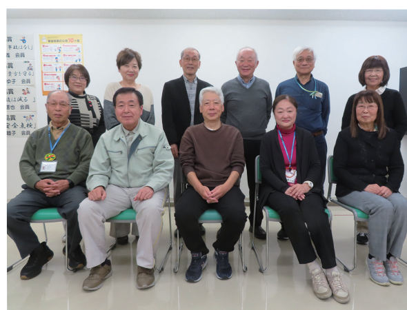
シルバーとだ 26 号は私たちが作りました(広報委員会)

昨年は、全国で 65 歳以上の人口の割合が過去最高を更新し、地域の支え合いやシニアの社会参加の重要性が再認識されました。戸田市では、昨年 11 月から買い物に行きにくい高齢者などが自宅の前で買い物ができる移動スーパー「とくし丸」の運行が始まり、シニア世代がより暮らしやすくなります。私たち戸田市シルバー人材センターもまた、地域の一員として、多岐にわたる活動に参加することができました。新しい年が、皆さまにとって健やかで穏やかな一年となりますよう、心よりお祈り申し上げます。本年も、どうぞよろしくお願いいたします。