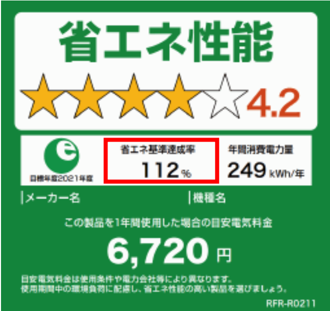
【統一省エネラベル】

(※1)①日付、②申請(購入)者氏名、③金額、④品名、⑤型番、⑥発行者が記載されているもの