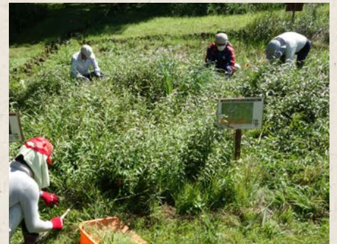
野草園の管理作業