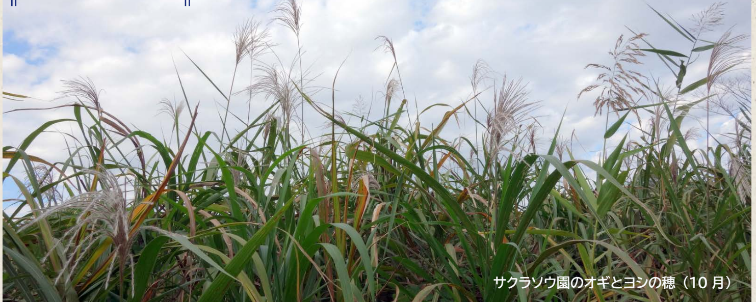
サクラソウ園のオギとヨシの穂（10月）

今年の9月はまだまだ暑く、管理活動も大変でした。 それでも10月、11月には秋晴れのもと、戸田ヶ原の自然 に親しみ、楽しむイベントに、市民のみなさんに参加をして いただくことができました。