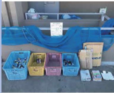
Sử dụng 4 loại giỏ. Giấy (trừ giấy bìa nhỏ) buộc bằng dây. Vải và giấy bìa nhỏ bỏ vào túi riêng.