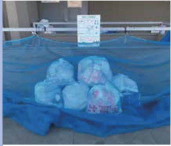
Chỉ bỏ rác trong túi, nhớ phủ lưới chống quạ.