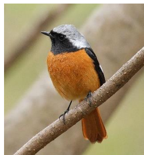
冬の定番ジョウビタキ。オスは目立つオレンジ色

彩湖周辺では年間100~110種の野鳥が観察でき、なかでも冬期は約80種(留鳥(※3)含)が見られます。センターでは双眼鏡の貸出しもしていますので、ぜひ野鳥観察に来てくださいね。(A.T)