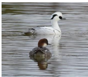
ミコアイサ。上がオスで下がメス

暑かった夏が終わり、寒さが厳しくなってきました。虫や植物がなんとなくさみしくなってくるこの時期、野鳥観察はこれから本番を迎えます。彩湖周辺の冬の鳥といえばカモの仲間。キンクロハジロやホシハジロをはじめ、コガモやマガモなどいろいろなカモが冬越しに来ます(※1)。カモの多くは越冬地で繁殖相手を見つけるため、オスは冬にきれいな羽に衣替えします。きれいなオ