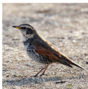
ツグミ。シベリアから1,700 kmを渡ってくる

を我先にと食べに来ます。葉が落ちる冬は鳥を見つけやすいので、どんな鳥が食べに来ているのか観察してみましょう。天然芝のグラウンドには土中の生き物を求めてツグミなどの鳥がやって来ますし、屋敷林の縁あたりでは藪や暗いところが好きな鳥が見られます。シロハラやアオジを探してみましょう。藪の中からは「ジャッ ジャッ」とウグイスの地鳴き(※2)もよく聞こえます。