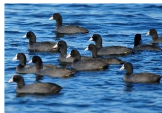
オオバン。カモっぱいけどクイナの仲間

スとちょっと地味な色のメスが一緒にいたらつがいかもしれません。彩湖・道満グリーンパーク内の観賞池にはここ数年12月にミコアイサというカモがやって来ます。オスは白と黒で「パンダガモ」と呼ばれる人気のカモです。カワセミも頻繁に見られるので散歩のついでにぜひ立ち寄ってみてください。他にも体が黒くてくちばしと額板(おでこ)が白いオオバン、白くて首の長いカンムリカイツブリなどがよく見られます。