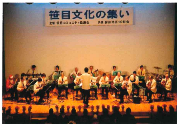
👆前回のコンサート風景