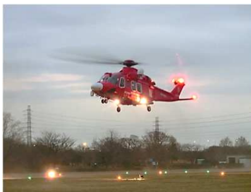
過去の訓練写真（道満グリーンパーク）