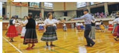
素敵なフォークダンス