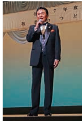
会場を魅了した歌謡ショー