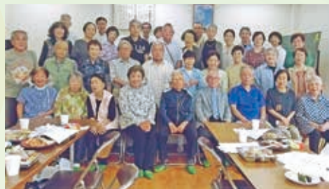
和やかに親睦を深めています

カラオケ会は演芸大会出場の練習や趣味の歌の披露をしています。絵手紙会では老連の作品