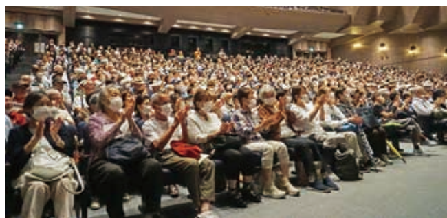
児童の歌声に表情ほころぶ会場席

さらに、くらし安心課より「戸田市が取り組む防犯対策」についての講話があり、特殊詐欺