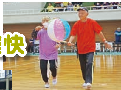
大事なのはコミュニケーション