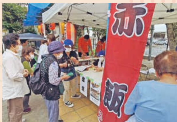
納涼祭でのお赤飯販売

また、自治会主催の納涼祭で、当倶楽部は、お赤飯を販売しています。本格的にせいろで蒸したお赤飯は大変好評で、あっという間に完売となります。毎年皆さまが待っており、行列ができるのです。