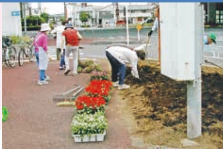
花壇を綺麗に心も明るく