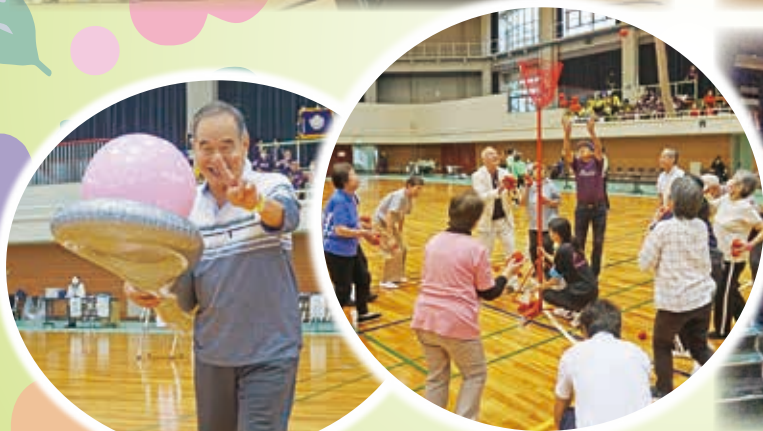
シルバースポーツ大会