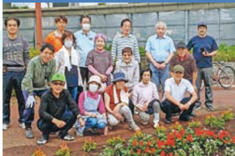
みんなで協力、地域をより良く