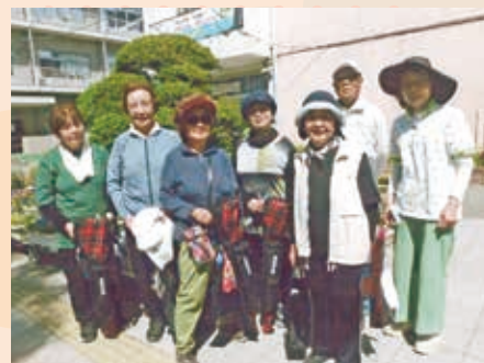
グラウンド・ゴルフ参加者

から月2回、公園清掃、および日曜日は戸田第二小学校において、グラウンド・ゴルフを開催いたしております。参加者は皆さま楽しんで行事に参加しております。