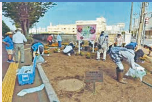
みんなで花を植えました