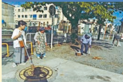
向田児童遊園地を美しく