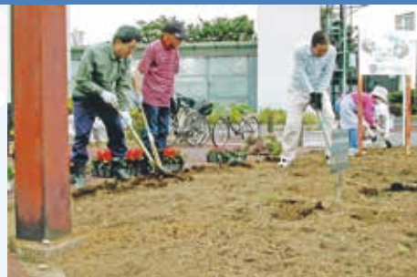
経験が光る手さばき