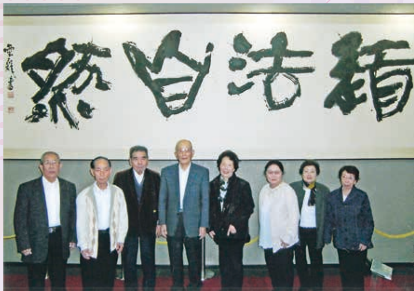
演芸大会に参加しました

会員数の少ない長寿会ですが、会員の健康と、楽しいクラブづくりを目標にみんなで力を合わせて頑張っています。