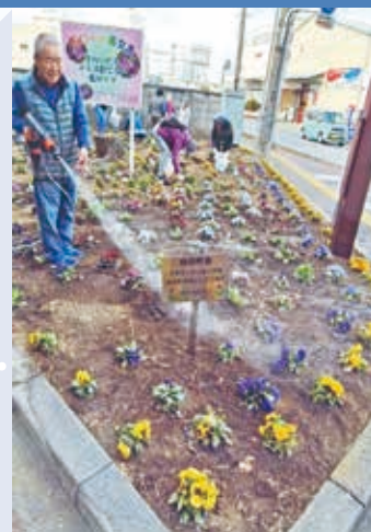
笑顔で花壇のお手入れ