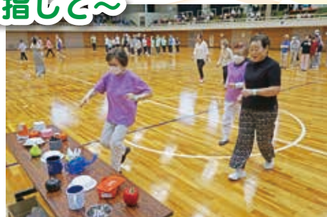
シルバースポーツ大会