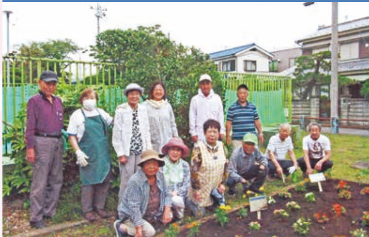
協力し合って奉仕活動