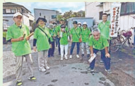
安全・安心のため町内を巡回

戸老連指示の「社会奉仕」は、高温多湿の近年、熱中症の心配もありますが、本年は「下町隅々パトロール」と名を打ち、会員約30名が2班に分かれ、町内隅々までパトロールをすることとしました。防犯チラシと会員募集のチラシを郵便受けに投函しながらのパトロールです。