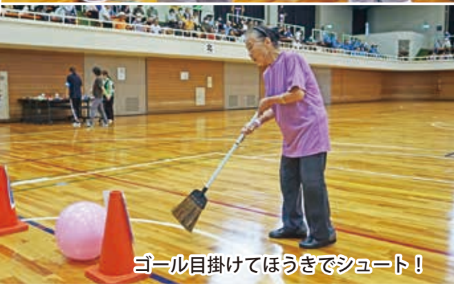
ゴール目掛けてほうきでシュート！