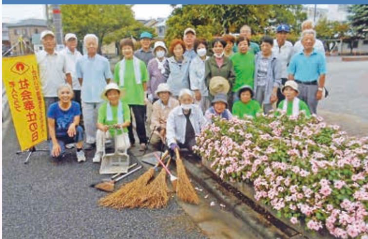
地域に彩りを添えて