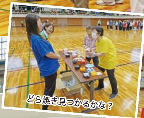
どら焼き見つかるかな？