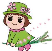
戸田ヶ原自然再生キャラクター とだみちゃん