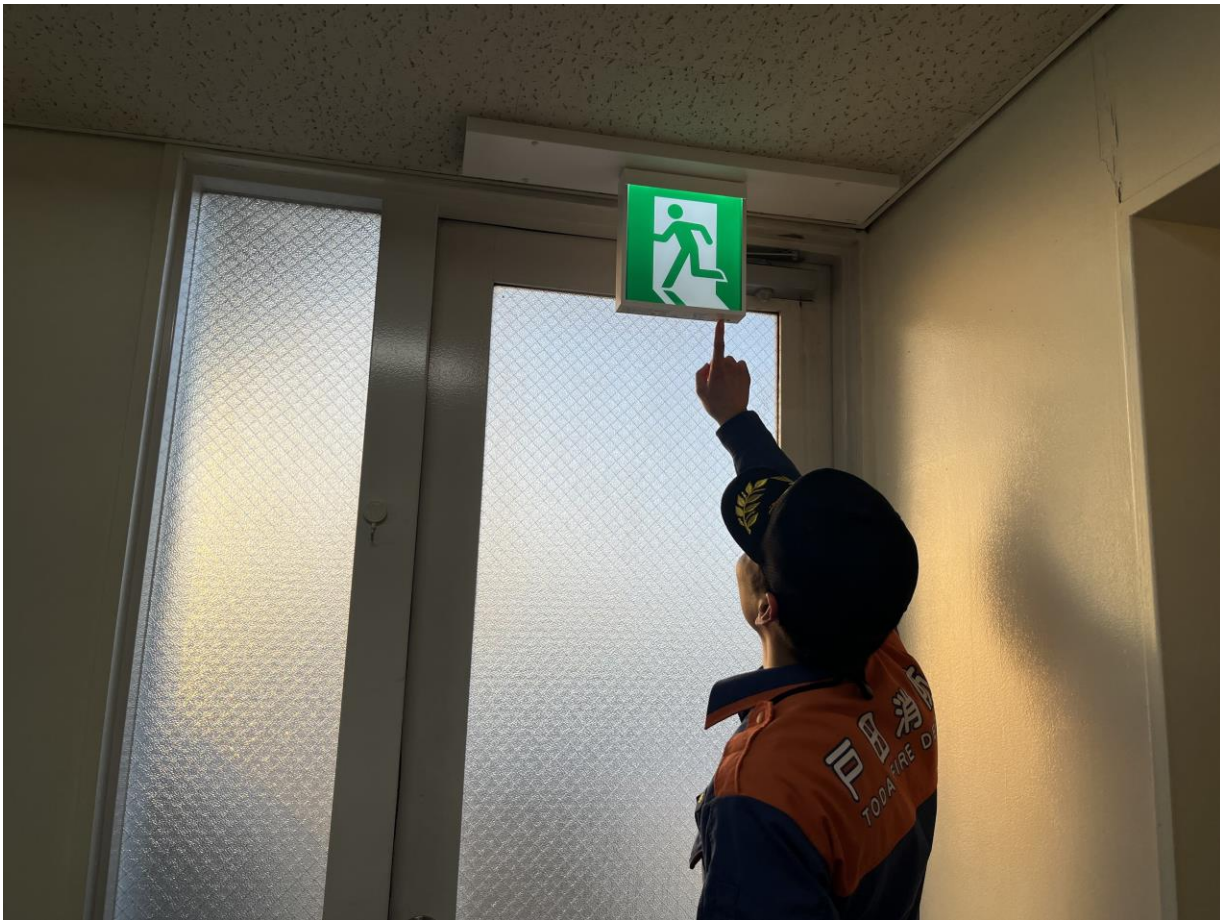
防火対象物の竣工検査の様子