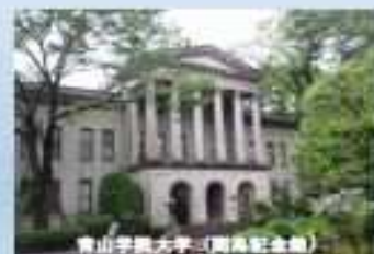
青山学院大学(南斎館)