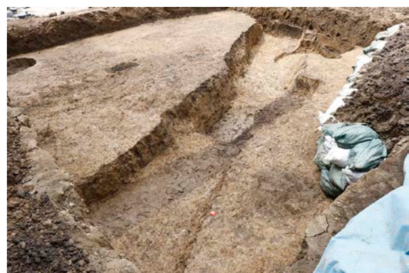
②前谷遺跡第 14 次調査完掘