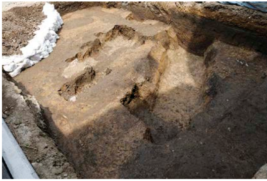
③前谷遺跡第 15 次調査完掘