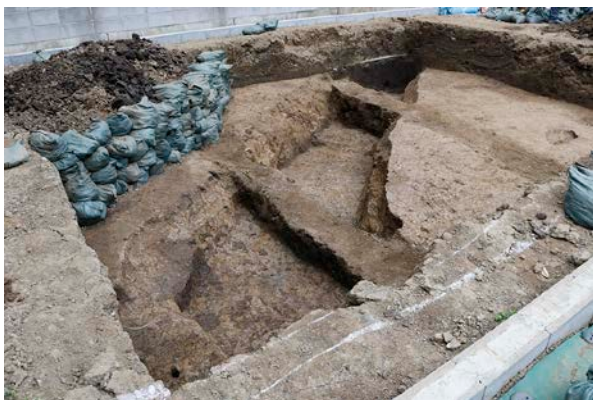
①前谷遺跡第 13 次調査完掘