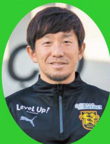
とだPR大使（プロサッカー選手）