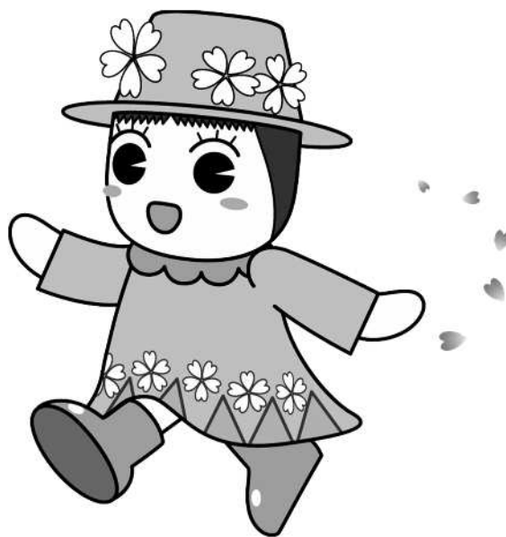
戸田ヶ原自然再生キャラクターとだみちゃん

子ども・子育て支援法が改正され、令和元年10月から幼児教育・保育の無償化が始まりました。私学助成幼稚園等を利用される方が無償化の給付を受けるためには、戸田市から施設等利用給付認定を受ける必要があります。 この案内では、私学助成幼稚園等の認定・利用に関する手続や必要な書類等について重要なことを記載しています。内容をよく読んで、申請してください。