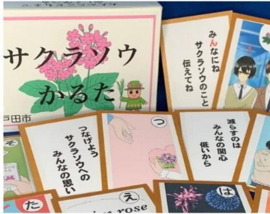
戸田市の花サクラソウを絶滅から救うために手作りのかるたを量産

PBLは、子供たちが自ら課題を立て、その解決に向けて取り組むことを通して、これからの社会で必要となる資質・能力を高める探究的な学習です。