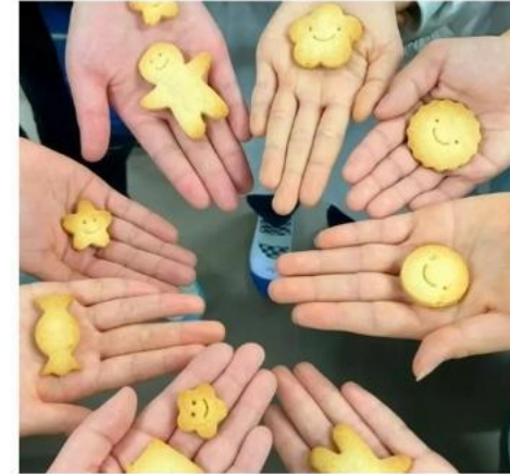
食品ロスを減らすために米粉を使ったお菓子を作って販売

地域の方の協力をいただき、たくさんのプロジェクトが成功し、子供たちの生きる力を高めています。 一方で、 まだ実現していない子供たちの思い があります。