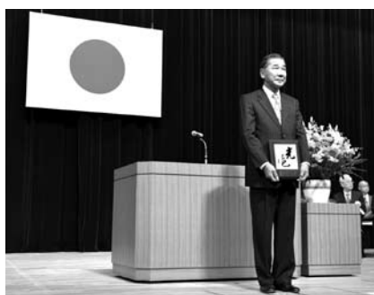
埼玉県更生保護大会にて