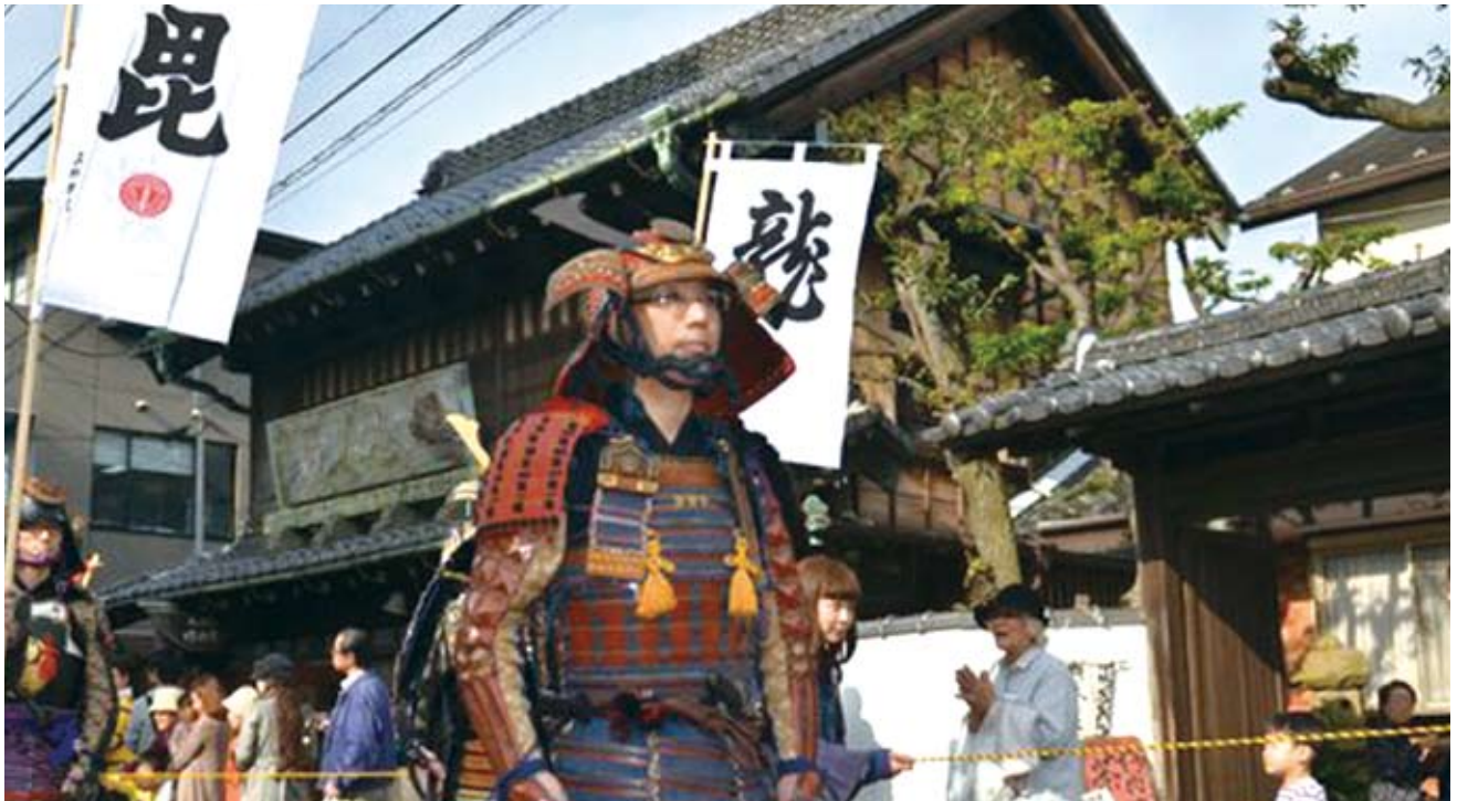
旧中仙道の宿場町の面影が残る『蕨宿』 —毎年 11 月に開催される宿場まつり—