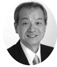
蕨市長 頼高 英雄

蕨・戸田地区保護司会の機関紙が発行されますことを心からお慶び申し上げます。日頃より更生保護活動や犯罪防止活動、青少年の健全育成をはじめ、市政推進にご尽力