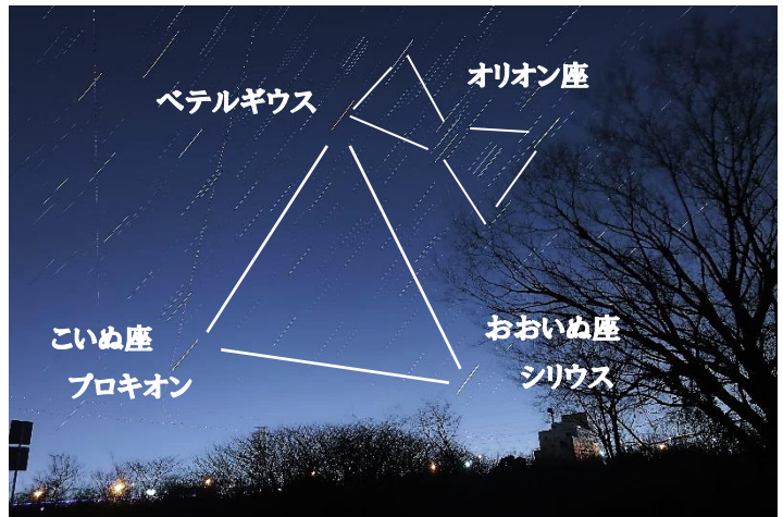
冬のダイヤモンド