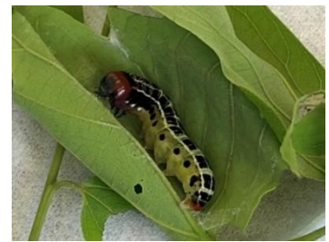
しろくろ白黒だとわかりませんが、頭は赤く体は緑色でカラフルです

今年の4月に幼虫を飼育しましたが、失敗してしまいました。来年の春にまた幼虫を見つけることができれば再チャレンジしてみようと思っています(R.Y)。