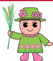
戸田市マスコットキャラクター 「とだみちゃん」