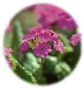
市の花 サクラソウ