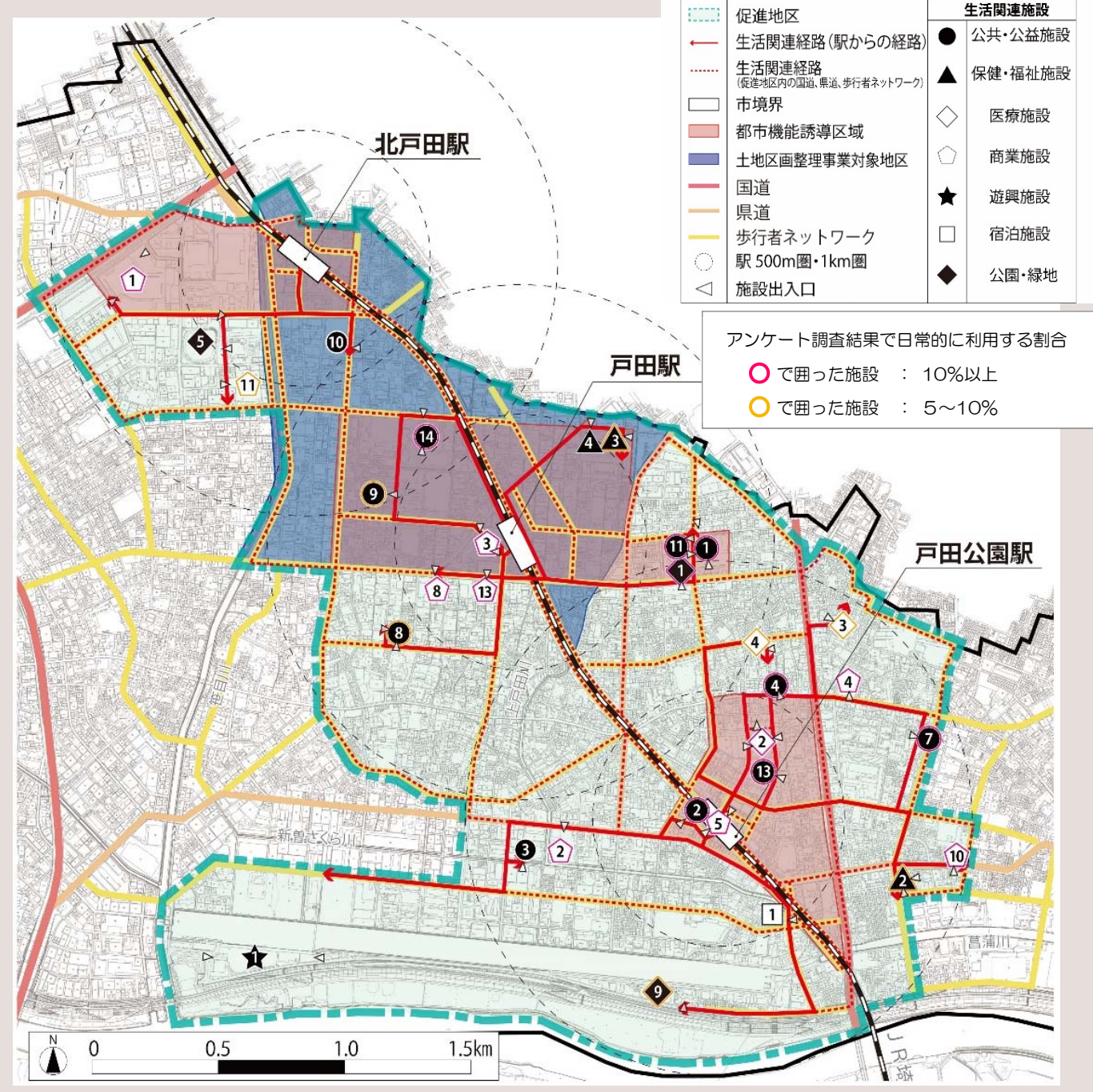
図 第4章 移動等円滑化促進地区の設定