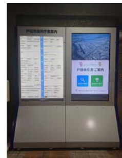
(デジタルサイネージの導入による広告料等の確保)