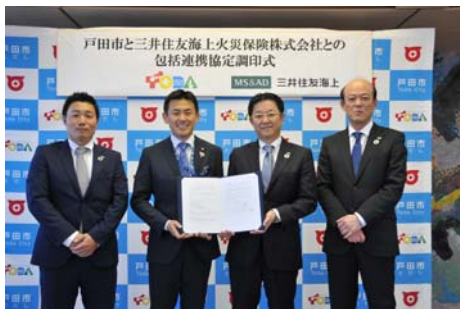
(包括連携協定調印式)

本窓口の開設等により、令和元年度は、7件の連携協定の締結や9件の公民連携事業を実施する事ができました。