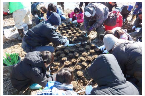
500株を植えるのは意外と大変! みんなで並べて場所を確認してから植え付けます。

4月現在、皆さまに植え付けていただいたサクラソウはきれいな花を咲かせています。また安心して皆さまが1号地に遊びに来れる日を楽しみにしています。