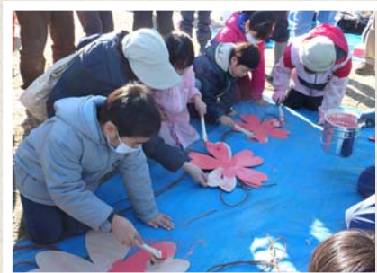
ペンキで色を塗ります。 丁寧にきれいに塗ってくれました。