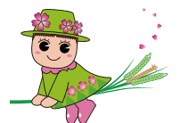
戸田ヶ原自然再生キャラクター とだみちゃん