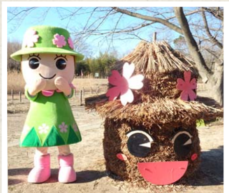
素敵なオギのとだみちゃんオブジェが 完成して、とだみちゃんもとっても嬉しそう!