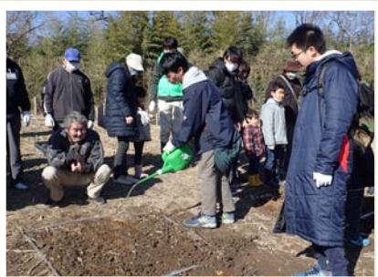
じょうろで水をあげました。 元気に育ってね!