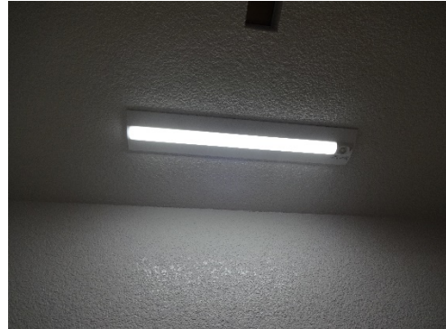
場所：1階から2階への階段