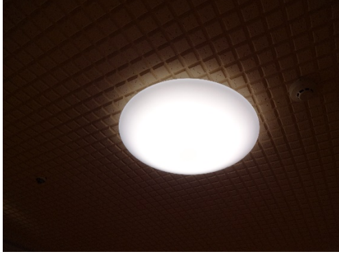
場所：1階 事務所出入口