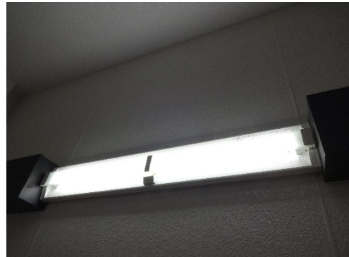
場所：2階から屋上への階段