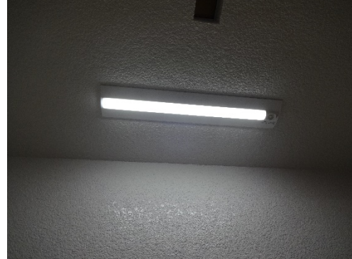
場所：1階から2階への階段