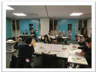
写真、第4回協議会の様子