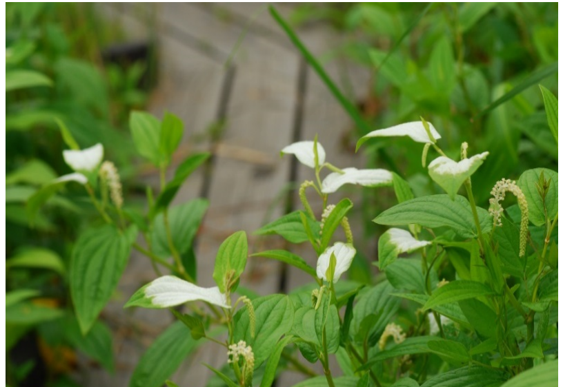
木道ぎわの白い花びらの植物

6月の梅雨時になると、センター周辺の濃い緑色の中に、白い花が目立ちます。ドクダミ科のハンゲショウとドクダミです。この2種類、どこかに似ているんです。それはまず、花の咲く時期が雨の多い6～7月頃。そして花に臭いがあるということ。人間にとってあまりいい臭いではないですが、虫たちはこの臭いが大好きなようです。