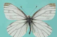
スジグロシロチョウ