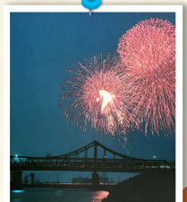
3代目戸田橋と 花火大会の様子 ▶

今年の戸田橋花火大会は、市制施行60周年記念大会として、8月1日(土)に開催を予定しています！ ※詳しくは2・3ページをご覧ください