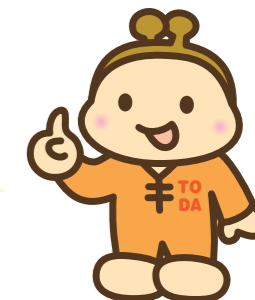
戸田市の財政案内人「おさいふくん」

数字は令和8年3月31日現在のものです。最終的な決算額とは異なります。令和7年度決算は、確定次第、市ホームページや『広報戸田市』などでお知らせします。