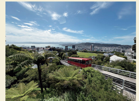
首都・ウェリントン