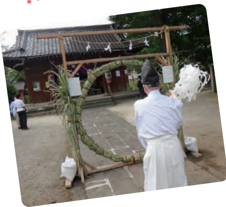
上戸田氷川神社 「夏越の大祓（茅の輪くぐり）」

茅で編んだ輪をくぐり、心身を清めて厄災を払い、参加者の無病息災を祈願する行事です。上戸田地区の町会長も氏子として盛り上げています。