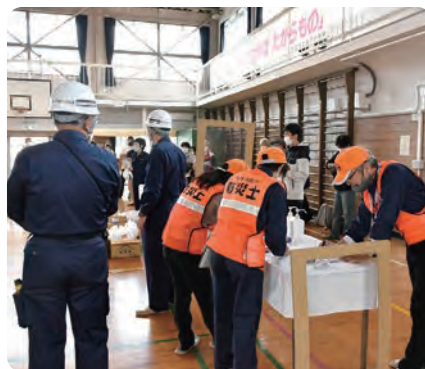
防災訓練 （喜沢1丁目町会）

みんなで協力して植えた花がきれいに咲いていると、いつも通る道もまち全体も明るくなります。