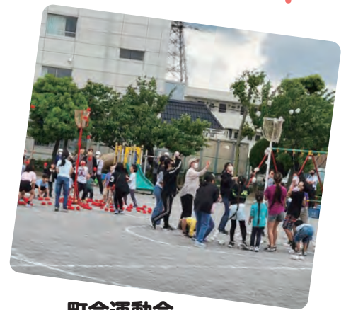
町会運動会 （笹目5丁目町会）

馬場町会には大人神輿・子ども神輿があり、誰でも担ぎ手になれます。神輿を通じて、みんなとの一体感を感じることができます。