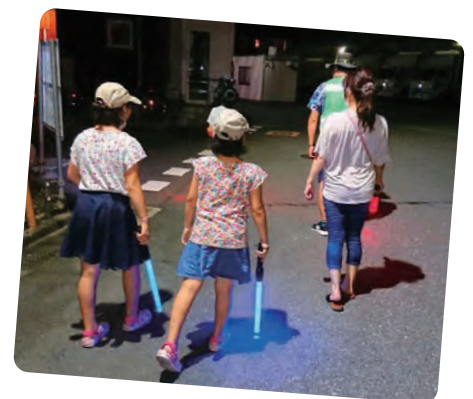
防犯パトロール （芦原町会）