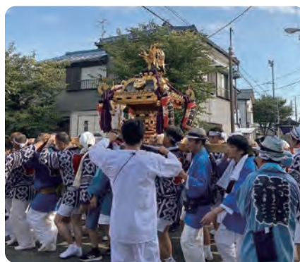
みこしとぎよ 神輿渡御 （馬場町会）

茅で編んだ輪をくぐり、心身を清めて厄災を払い、参加者の無病息災を祈願する行事です。上戸田地区の町会長も氏子として盛り上げています。