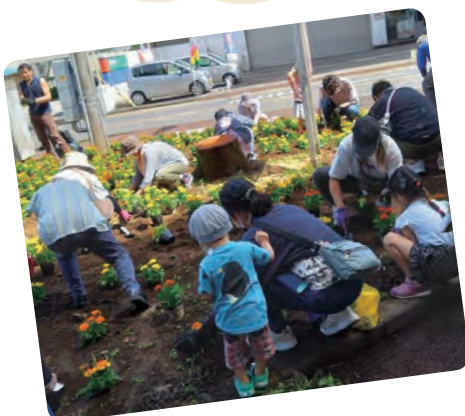
花ロード（植栽） （向田町会）

地域の子どもからお年寄りまで、みんな笑顔で楽しく盛り上がります。最後はみんな輪になって戸田音頭！