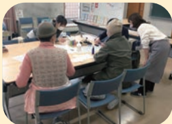
おしゃべりサロンの開催▲

CSWが地域で不安や悩みを抱えた方を適切なサービスにつなげるとともに、個別の生活課題を地域で支え合う仕組みをつくりまします。