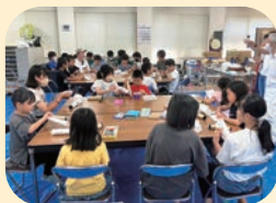
まごころこども塾▶

子どもが安全、安心して過ごせる居場所づくりを進めるため、活動団体の支援や育成を行っています。