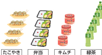
たこやき 弁当 キムチ 緑茶

問題1 前から3番目・前から2番目・前から3番目・前から5番目をとると「やんちゃ」になるとき -----をすと何になる？