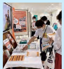
認知症啓発展示の様子