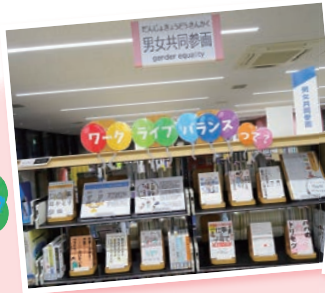
あいパルキャラクター あい本(あいほん)

2階図書館(上戸田分館)の男女共同参画書架では、新刊本コーナーや特集棚で図書を紹介しています。