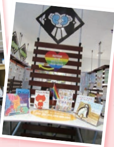
あいパルキャラクター ぱるぱるちゃん

1階男女共同参画情報コーナーでは、女性の就労・起業のための講座情報やDVについての資料を配架しています。