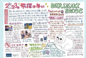
お客様に配っているチラシ

新たな経営者となる私をサポートしてもらえる体制も整えられ、先代が元気なうちに店を引き継ぐことができました。