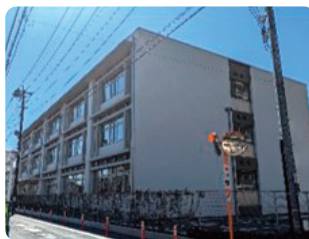
新曽小学校 (増築校舎)