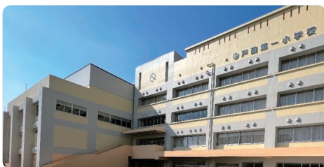
戸田第一小学校 (西側新校舎)