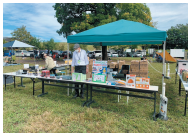
アウトドア用品・フェースフリー用品の体験会