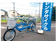
二人乗りタンドム自転車のレンタルサイクル